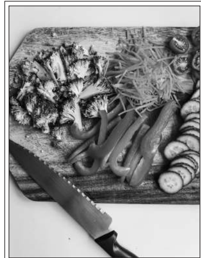
Sliced Vegetables

III Scientists also found that children who eat vegetables every day continue to include vegetables in their diets, even when they are adults. And these adults who eat vegetables have better health and 15 more active brains. So, healthy eating habits that we learn in childhood stay with us and are important later in life, too.