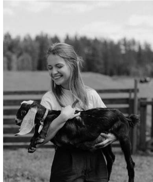
Woman Holding a Black and White Goat

III So, if you are thinking of getting a pet, a goat seems to be a good choice. But is your home a 15 good place to keep a goat?