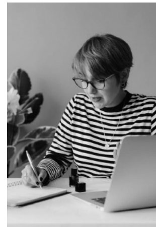
Woman learning on the internet