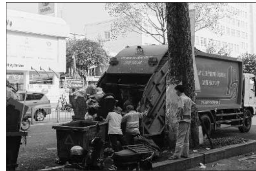
Garbage collectors